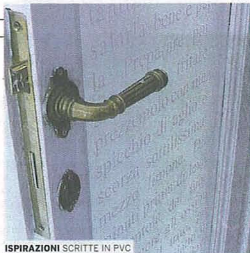
ISPIRAZIONI SCRITTE IN PVC

■ NONSOLOMAGLIA. VIA PESTALOZZI 10 ☎ 02.89.12.59.47 (TUTTI I GIORNI).